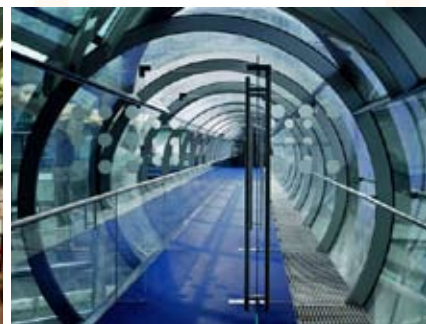
Nordeutsche Landesbank Am Friedrichswall, Hannover, Germania, 2002